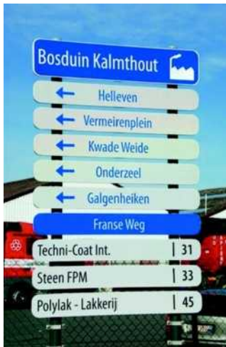
De KMO-zone Bosduin, met heel wat plaats voor nieuwe bedrijven