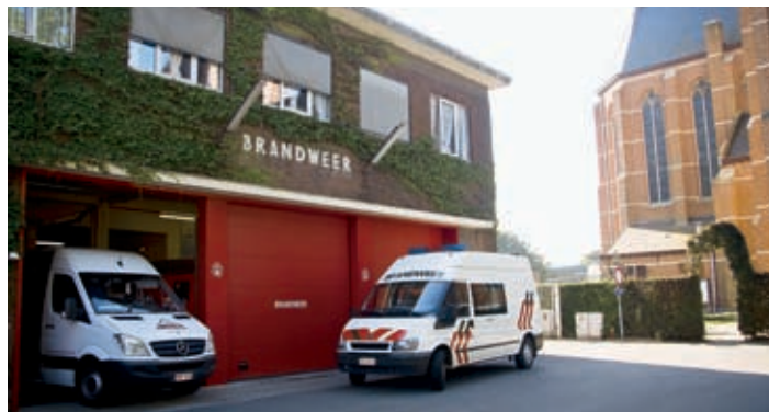
De brandweerkazerne: op deze plaats komt ruimte voor een cultureel centrum en de uitbreiding van het gemeentehuis.

ruimte van de huidige brandweerkazerne geeft zo plaats aan de noodzakelijke uitbreiding van de gemeentediensten en een grote ruimte als cultureel centrum met polyvalent gebruik”.