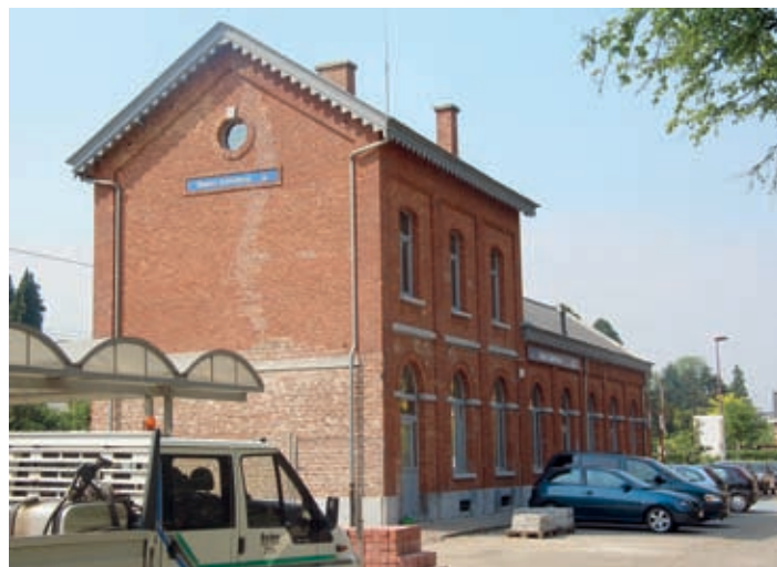
Het station van Kalmthout. Straks is er plaats voor meer dan 200 parkeerplaatsen, het dubbele van vandaag.

flats, centraal in de gemeente, in de buurt van winkels en andere voorzieningen. In het geval van Sint-Vincentius komen de serviceflats naast het huidige gebouw, aansluitend bij het toekomstige woon- en zorgcentrum met vele voorzieningen op maat van de ouderen. Opmerkelijk is de houding van SP.a-Kalmthout in dit dossier. Onder hun impuls werd de strijd aangegaan tegen de bouwvergunning voor deze nieuwe serviceflats. Ze vroegen de schorsing bij Stedenbouw, maar die reageerden niet en steunden zo de bouwplannen. Zo is nu de weg vrij voor een belangrijk bouwproject met goede en betaalbare huisvestingsmogelijkheden voor de senioren.