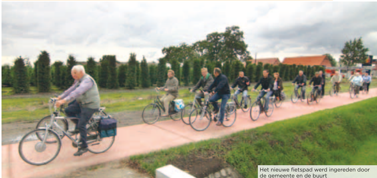
Het nieuwe fietspad werd ingereden door de gemeente en de buurt