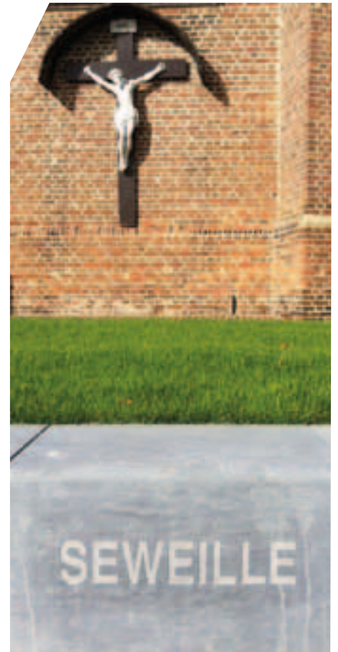
Eén van de Nieuwmoerse woorden op de muur rond de kerk

en de eigen Nieuwmoerse woordenschat. De mooie kubus achter de kerk staat voor 'de Eerste Steen', net op de plek van de oorspronkelijke bewoning. Nieuwmoer is ontstaan door de turfwinning en dus mocht het bronzen beeld van de 'Tufsteker' niet ontbreken. Op de arduinen muur tenslotte werden typische Nieuwmoerse woorden