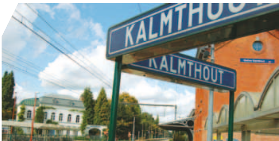
De gemeente protesteert tegen de aangekondigde sluiting van de loketten in het station van Kalmthout

Enkele weken geleden tekende de gemeente protest aan tegen de geplande sluiting van het loket in het station van Kalmthout. De NMBS plant volgend jaar de sluiting van een aantal stationsloketten omdat er minder dan 100 tickets per dag worden verkocht en daarmee ‘de kosten voor het openhouden te hoog worden’.