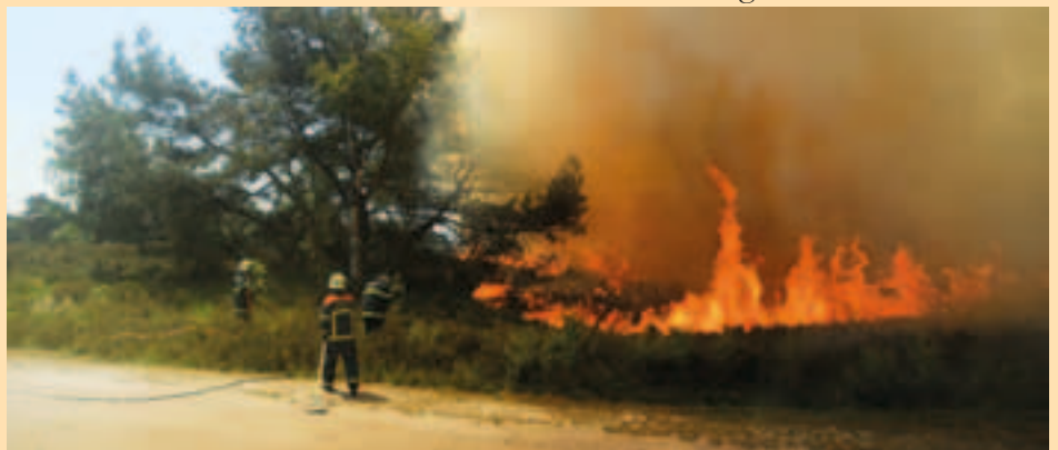
Op de info-avond werd een chronologisch verloop gegeven van de brand op de heide

Tot slot gaf de burgemeester een overzicht van de voornaamste conclusies en aanbevelingen na de heidebrand. Daarbij kwamen de thema's aan bod zoals het preventief afsluiten van de heide in brandgevaarlijke perioden en het aanleggen van toegankelijke brandgangen. Hij gaf ook aandacht aan de engagementen van de ministers om middelen te voorzien voor geschikt brandweermaterieel in de omgeving van noord-Antwerpse natuur- en bosgebieden en om het heideherstel alle kansen te geven.